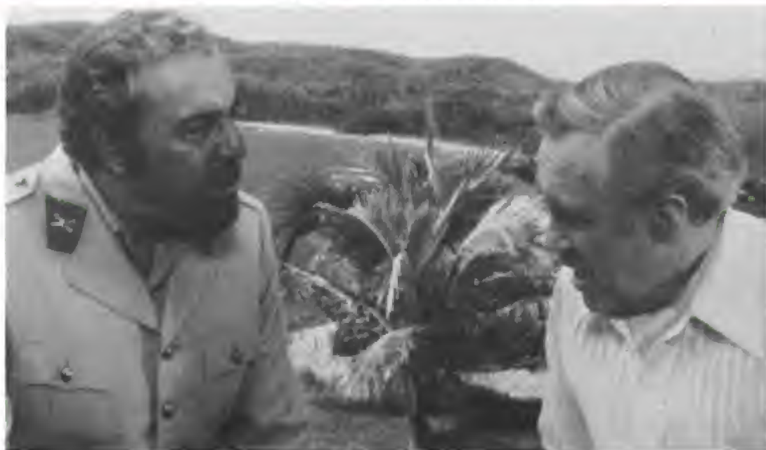
Fernando Rey – Jason Robards